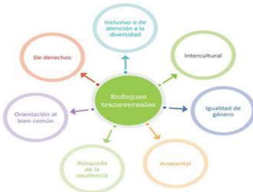
Figura donde podemos observar los diversos enfoques transversales.