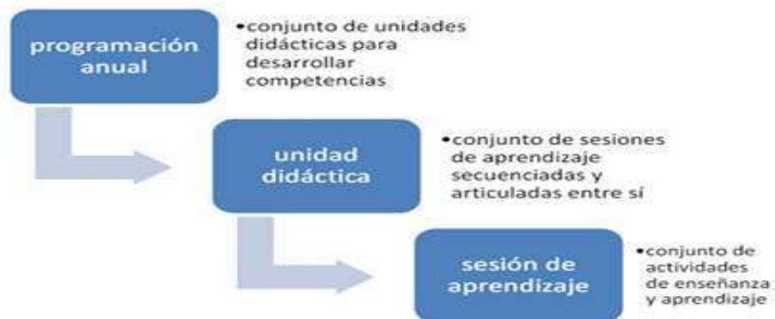
Figura donde podemos observar la secuencia de planificación.